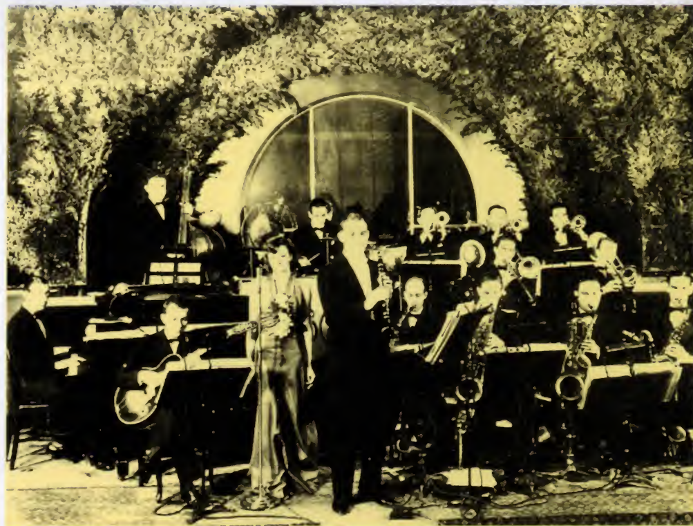
Goodman y su orquesta en el Congress Hotel de Chicago (1935).

(*) La palabra " Swing " (posiblemente la que más se repita a lo largo de toda esta obra) significa literalmente en inglés: balanceo. Es una cualidad rítmica característica de las obras de jazz, una manera especial que tienen los músicos de hacer "vivir" el ritmo y que depende del sentido, tanto individual como colectivo, que tienen de él. Técnica y físicamente corresponde al balanceo de un tiempo a otro del compás que genera una sensación dual (y de hecho un efecto) de "tensión-relajación" que se produce alternativamente a cada golpe del ritmo. Pero para el intérprete sigue siendo una cuestión subjetiva de cómo percibe el ritmo expresado por el músico. No hay receta para ello. Lo mismo ocurre con el oyente, para quien el swing es también una cuestión subjetiva. Por otra parte (y en relación directa con las expresiones al origen de esta nota), a partir de mediados de los años treinta la palabra "swing", desprovista de su auténtico significado, fue utilizada por los medios de comunicación para designar, con propósitos promocionales y publicitarios, el estilo de jazz imperante en esa época dorada de las grandes orquestas.